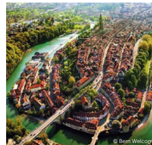
Berne – Unesco-Weltkulturerbe Berne – Patrimoine mondial de l'UNESCO

verdure et son jardin accueillant. «Bern Ticket» pour tous les hôtes du camping: utilisez gratuitement les transports publics , y compris les téléphériques du Gurten et du Marzili.